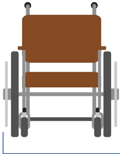
30 pulgadas de ancho MÁXIMO

PESO DE LA SILLA DE RUEDAS: 600 libras MÁXIMO